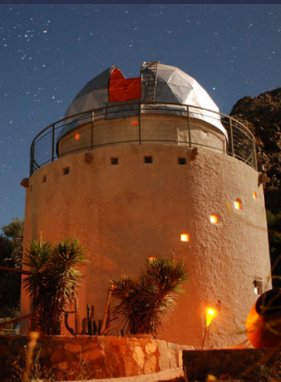
LOCALIDADES COMUNA DE PAHUANO (DATOS REFERENCIALES)

El aire puro, aguas frescas y cristalinas, azules cielos, energía que fluye y cálida gente, son algunas de las virtudes naturales de esta comuna. Zona que llama la atención por sus contrastes, con coloridos cerros, una vegetación que hace contrapunto con la aridez y un cielo que esta considerado dentro de los más transparentes del planeta. Este atractivo natural ofrece una tranquilidad incomparable lo cual hace que sea reconocido mundialmente como un lugar ideal para actividades de relajación y meditación, concentrándose principalmente en el valle de Cochiguaz, cuya fama mística trasciende nuestras fronteras.